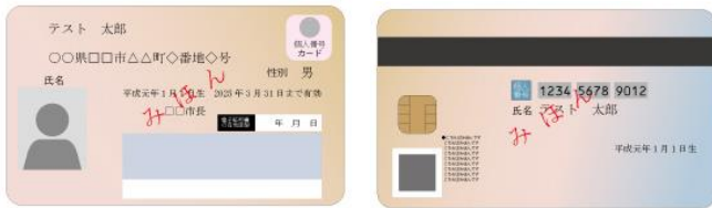
(表面) 個人番号カード (裏面)